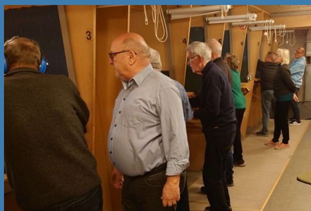
Ældresagen i Tårnby til arrangement hos API i 2024