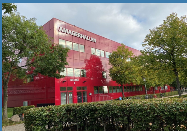
Indgang, siden 2021, til API Skytteforening i Amagerhallen