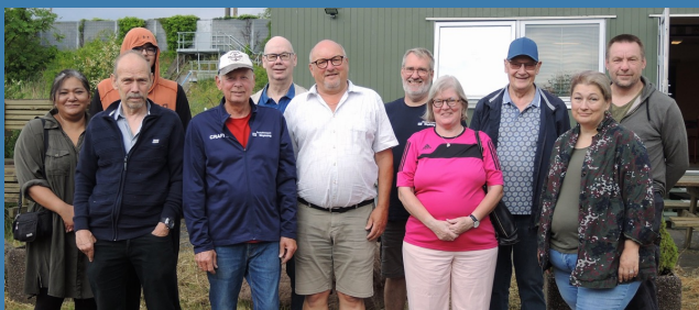
Riffelholdet ved sæsonafslutning 2023 på Københavns Skyttecenter