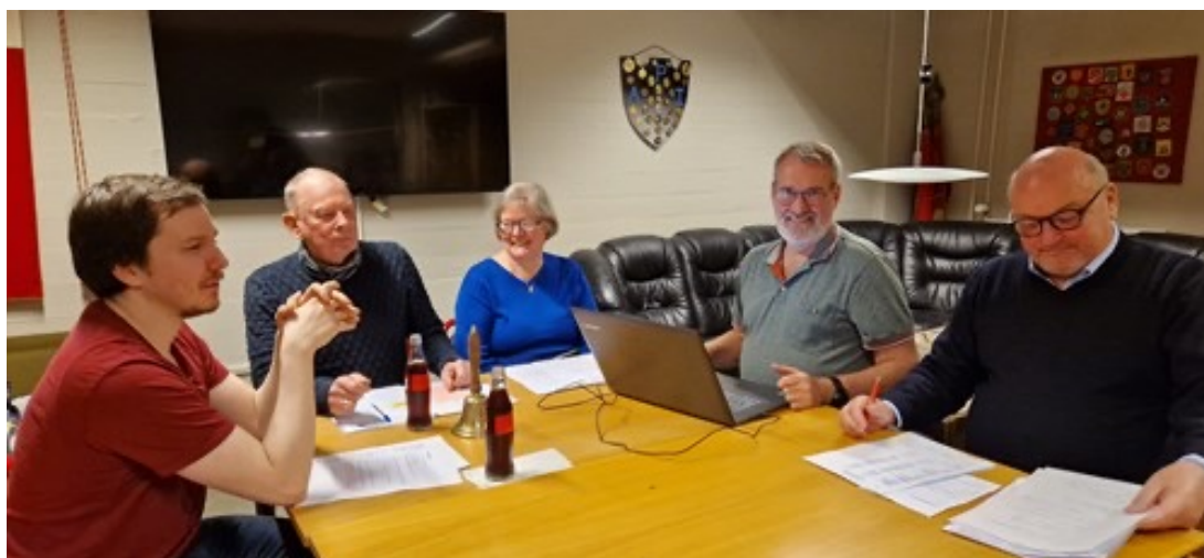
Bestyrelsesmøde i API Skytteforening i 2024