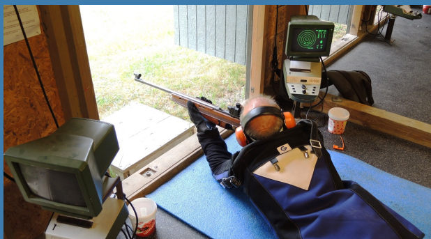
Liggende skydning ved sæsonafslutningen i 2023