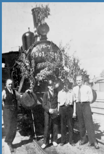
Amagerbanens 40 års jubilæum to år før, vor klub startede. Kastrup 17. juli 1947.