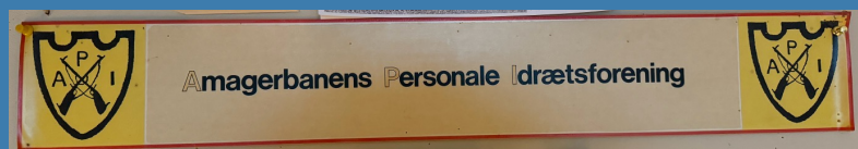
API logo fra tiden på Amager Landevej