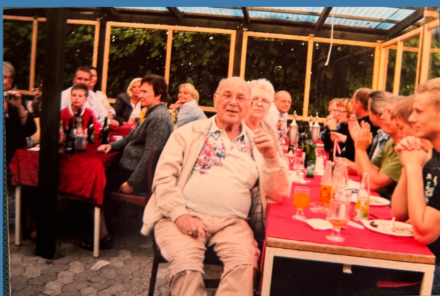
Sommerfest på Amager Landevej