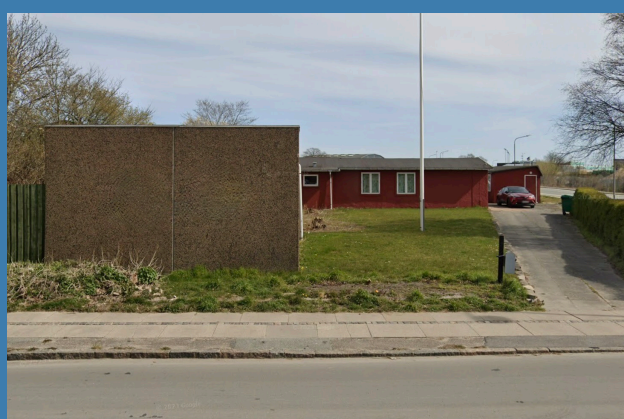
API's lokaler på Amager Landevej 221 indtil 2021, hvor klubben flyttede til Amagerhallen