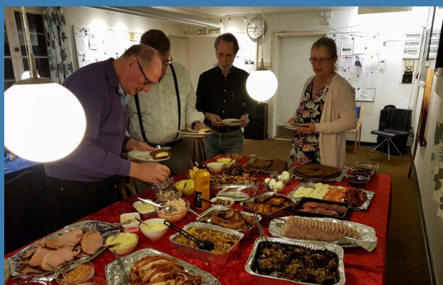
Julefrokost på Amager Landevej