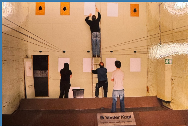
Vores gamle skydebaner på Amager Landevej