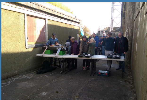
Sommerskydning med laser på Kongelundsfortet