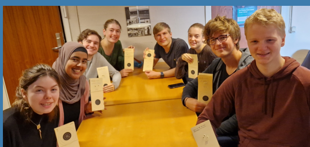
70 gæster besøgte API på skydesportens dag i 2023