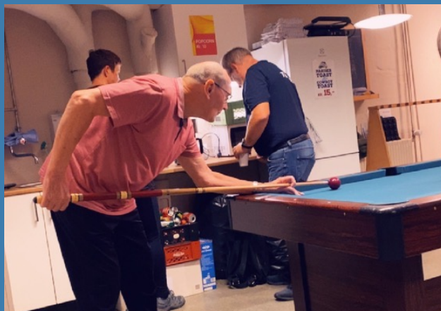
Billardbordet og dartskenen bliver flittigt brugt på en træningsaften