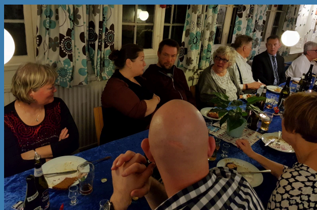
Julefrokost i 2017 på Amager Landevej