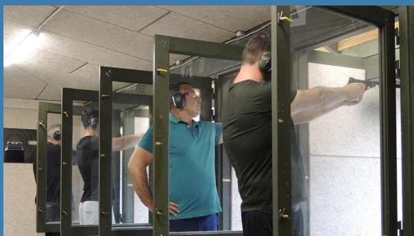
25 meters pistolskydning på Københavns Skyttecenter