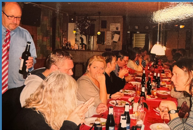
Julefrokost på Amager Landevej